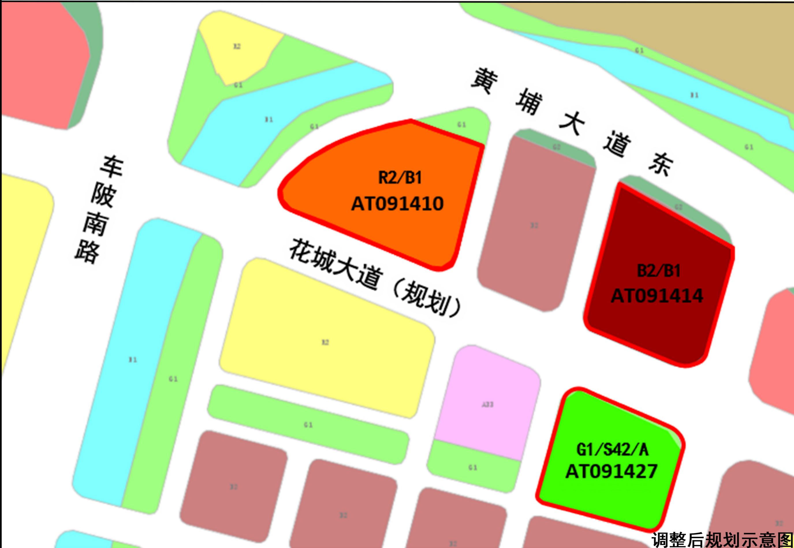
调整后规划示意图