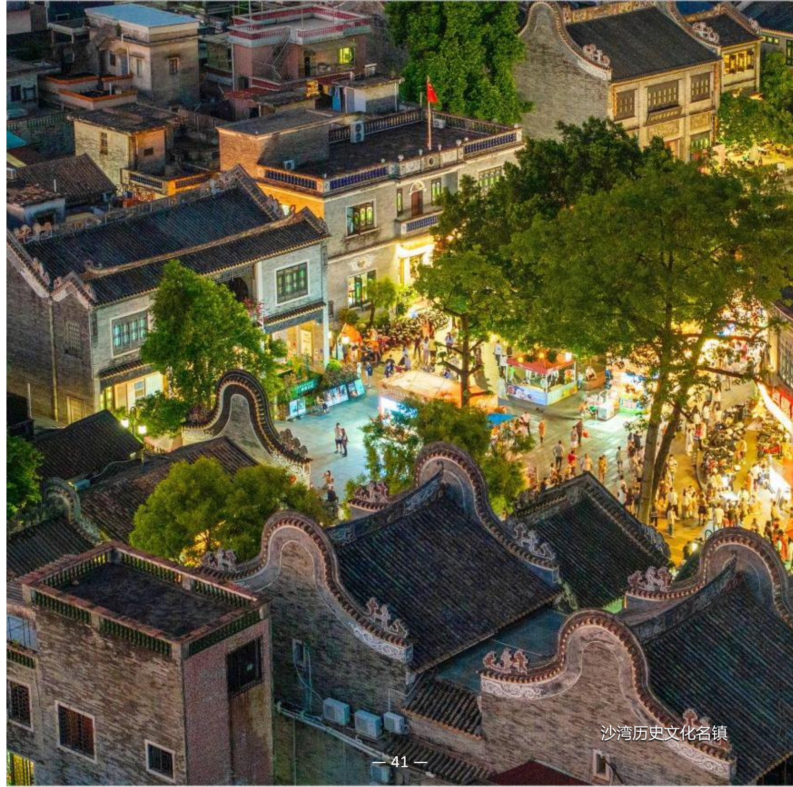
沙湾历史文化名镇