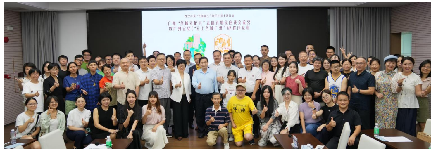
广州“名城守护官”志愿者组织座谈交流会