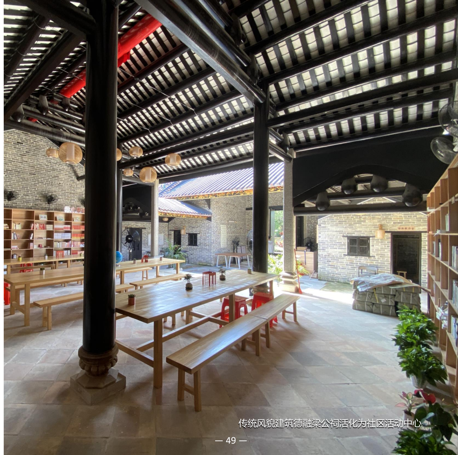
传统风貌建筑德融梁公祠活化为社区活动中心