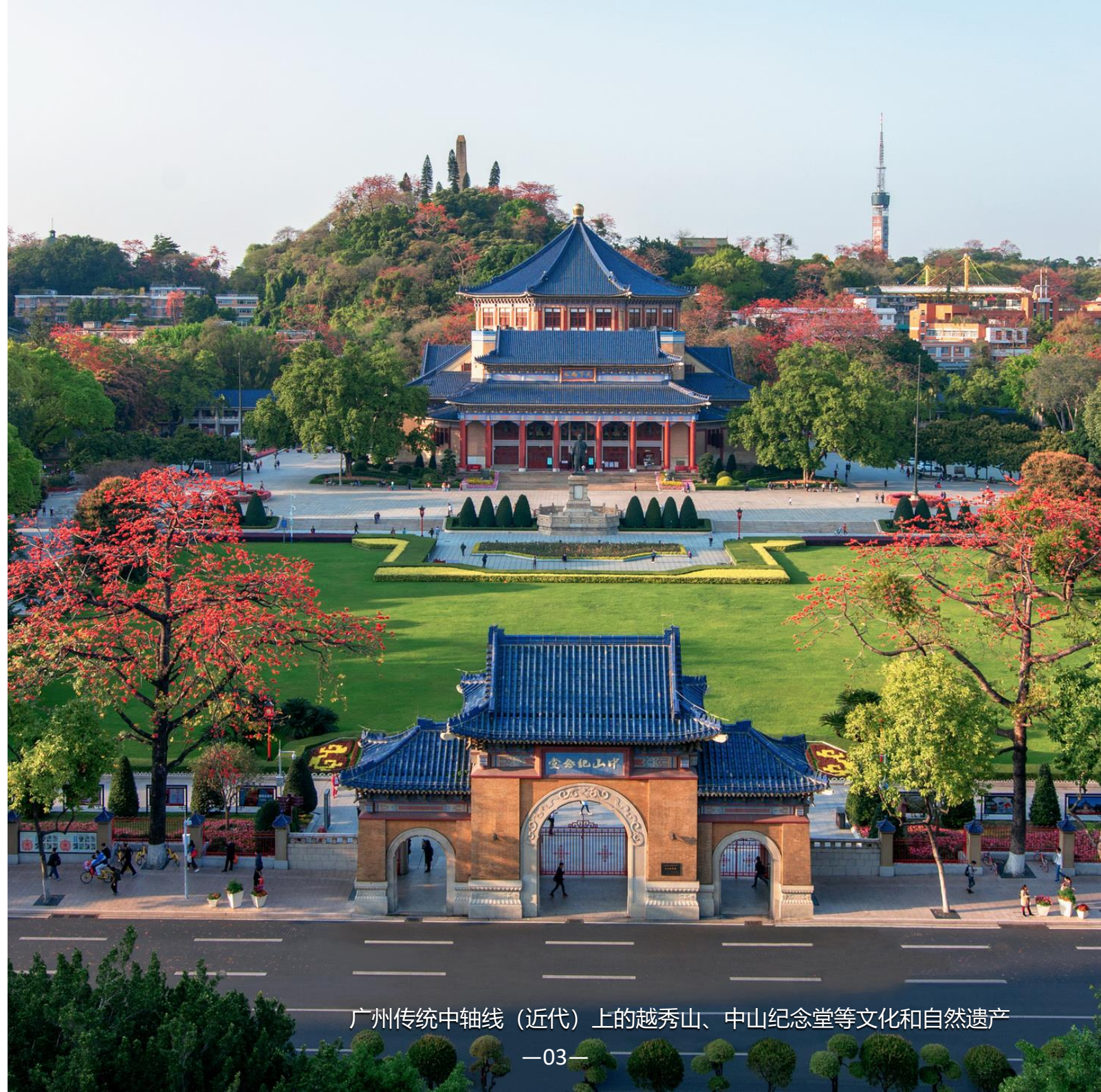
广州传统中轴线（近代）上的越秀山、中山纪念堂等文化和自然遗产

规划以“ 岭南文化中心，魅力开放门户 ”为目标愿景，巩固岭南文化中心的历史地位，彰显海陆交融的文化格局，在千年花城迈向中心型世界城市的新时期，加强广州作为中华文明对外交往的魅力开放门户、海上丝绸之路的文化母港城市、粤港澳大湾区的历史文化中心的重要作用。