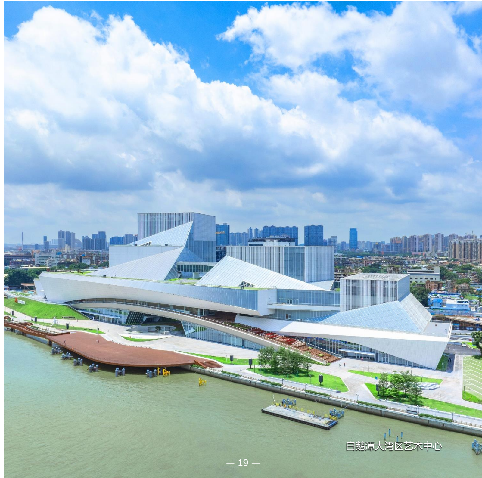
白鹅潭大湾区艺术中心