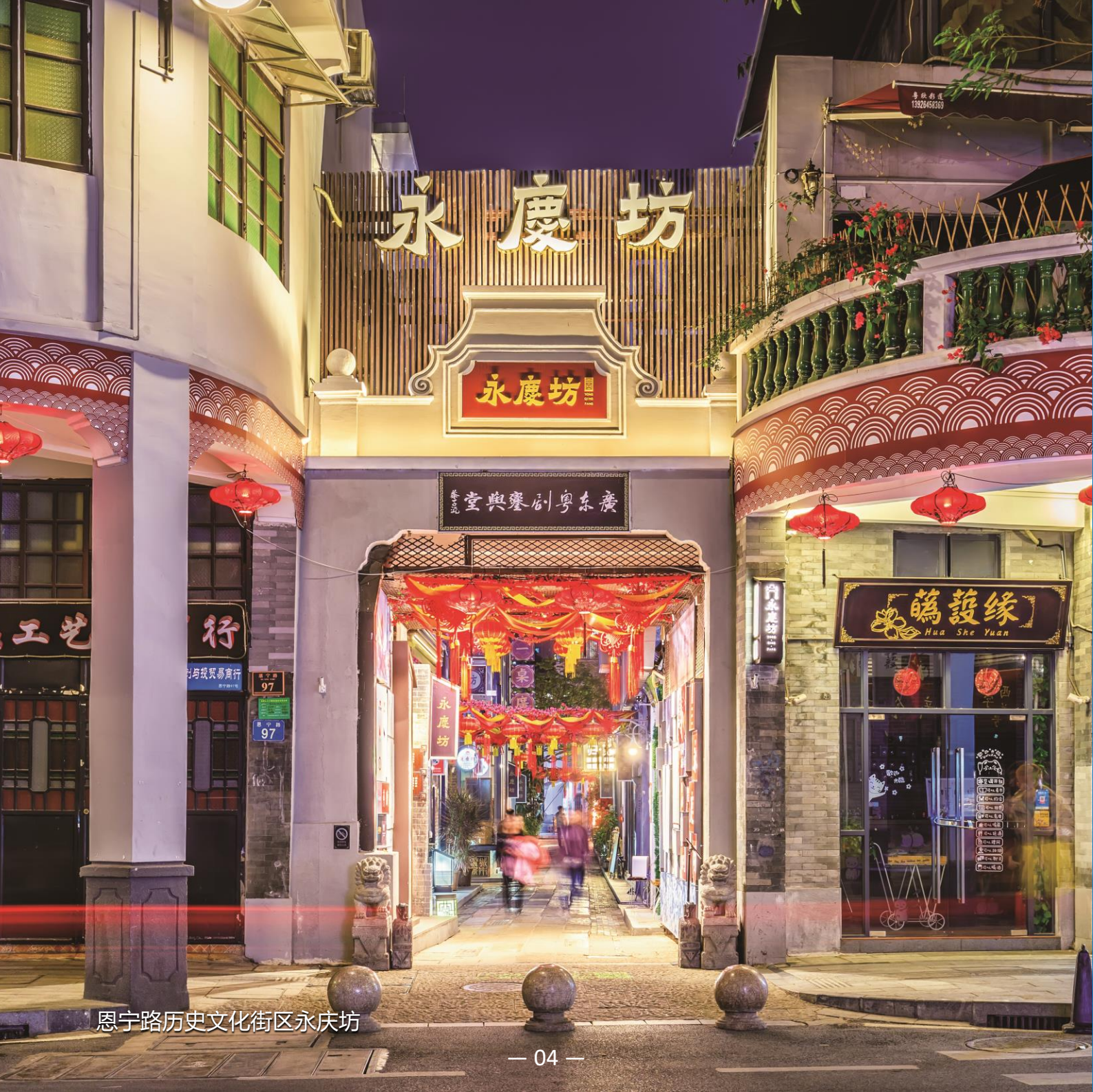
恩宁路历史文化街区永庆坊