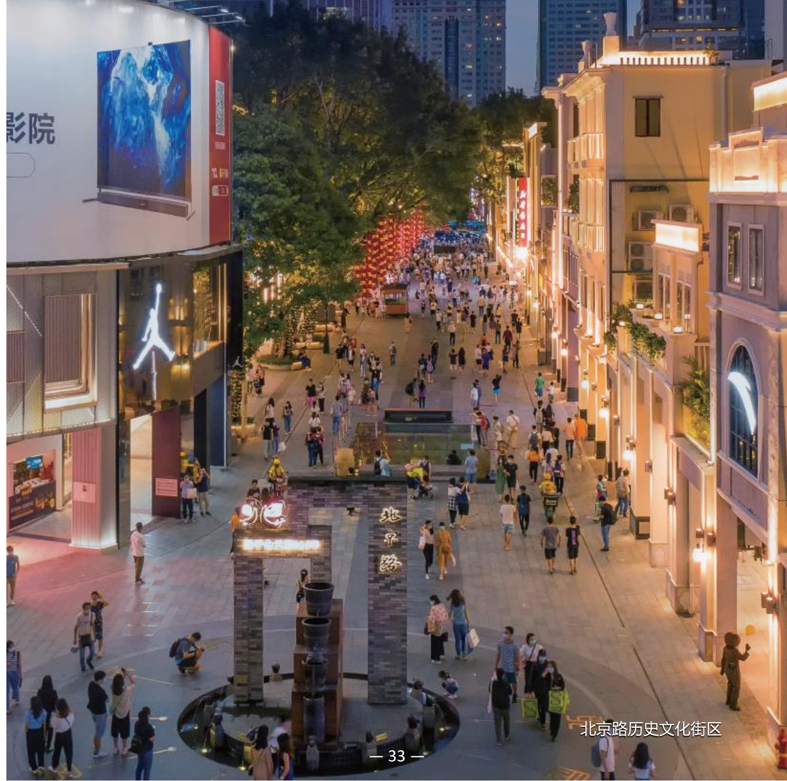
北京路历史文化街区