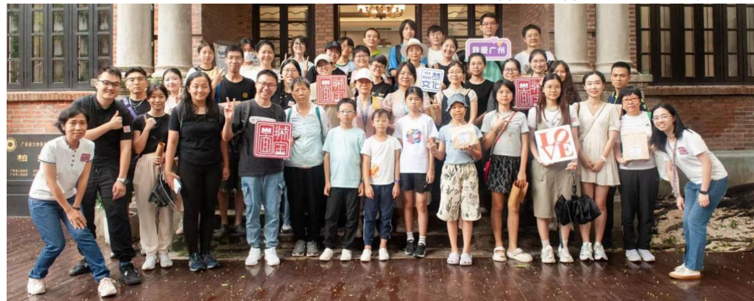
“老城新生”伙伴计划主题导赏活动