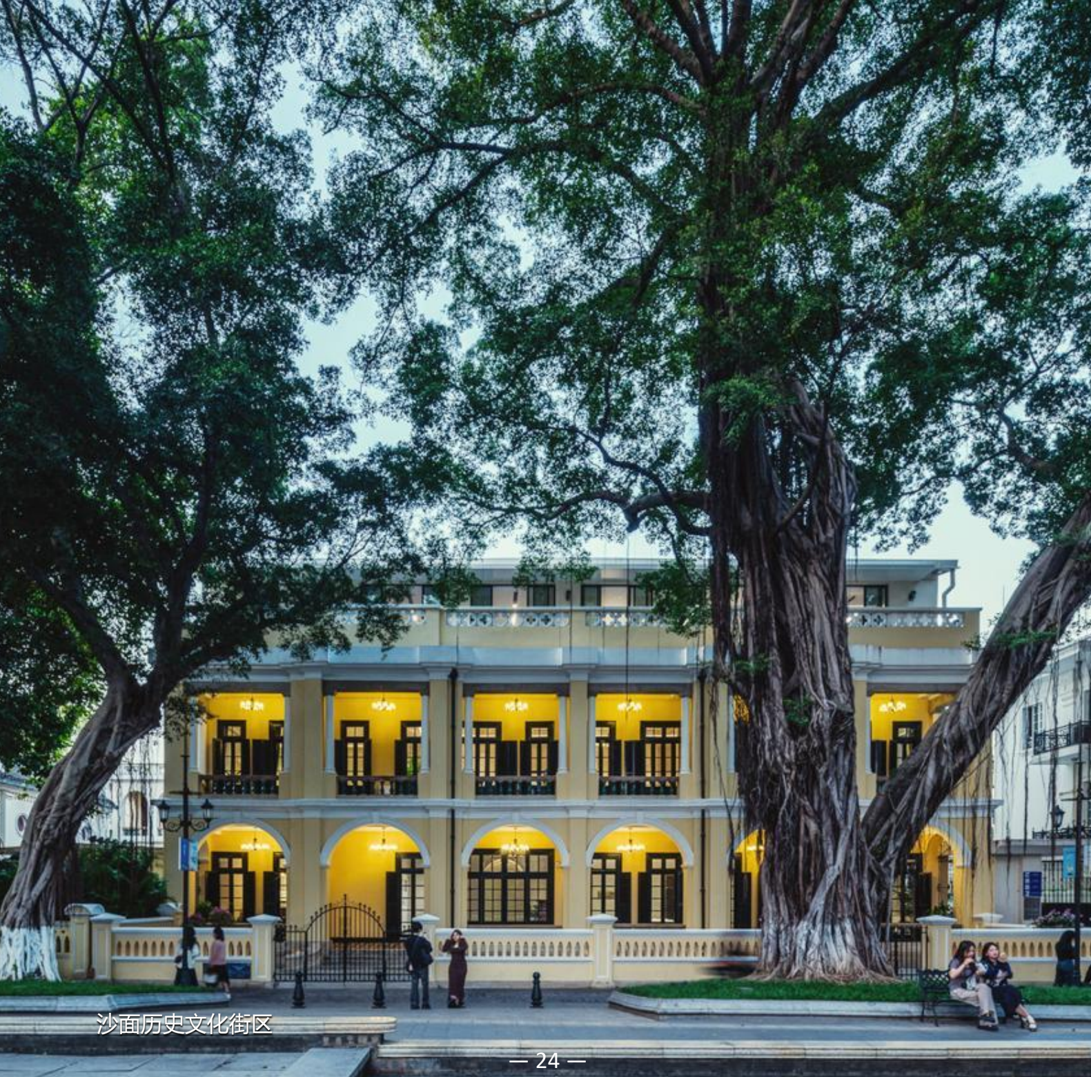
沙面历史文化街区