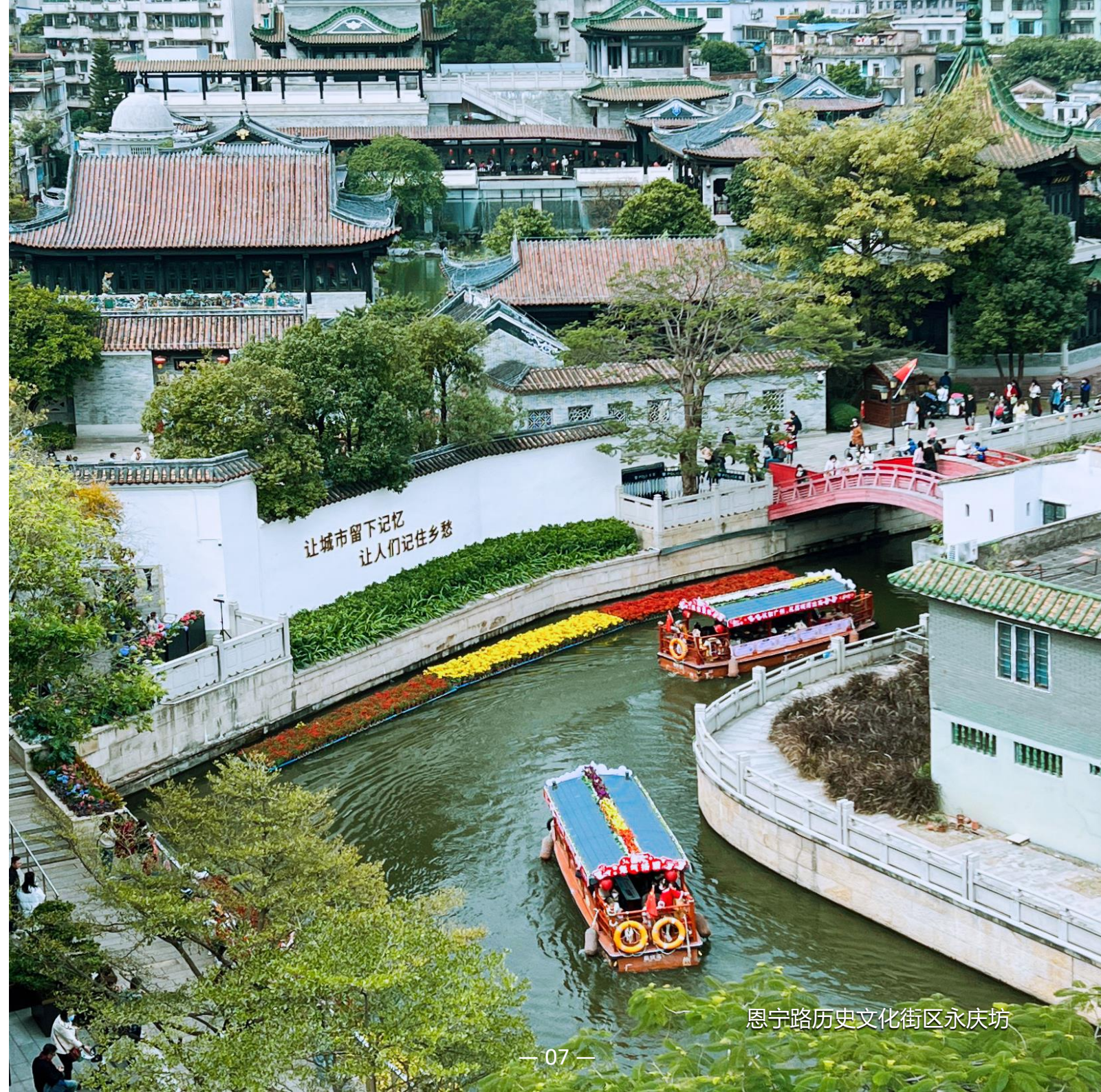
恩宁路历史文化街区永庆坊