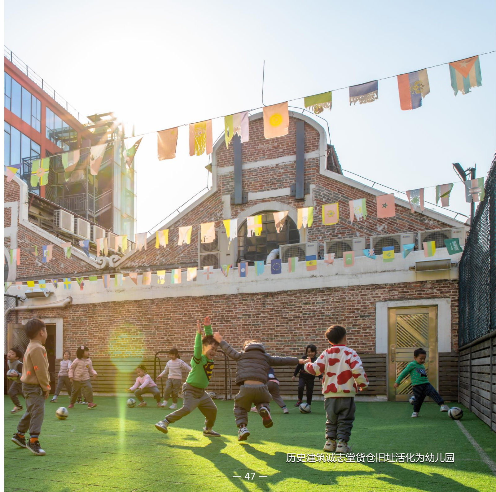
历史建筑诚志堂货仓旧址活化为幼儿园